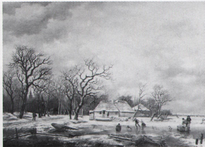
8. Winterlandschap met herberg, 63 x 78,7 cm., ca. 1820 (Simonis&Buunk, Ede).