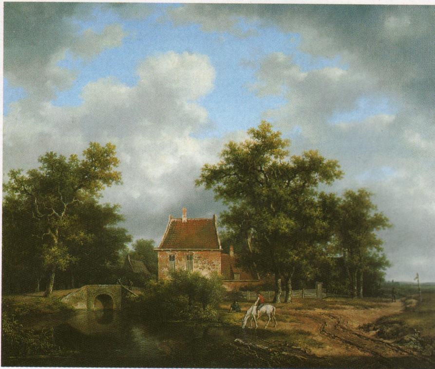
3. Zomerlandschap met ruiter, 37,3 x 42,7cm.