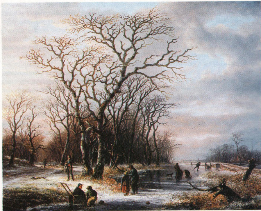
2. Winterlandschap, 1812, 42 x 52cm. (Kunsthandel A.H. Bies, Eindhoven).

met herberg (afb. 8), dat Schelfhout schilderde rond 1820. Het ijs is al zo natuurgelukkig weergegeven dat het lijkt alsof de klompjes ijs rondom het wak even daarvoor uit de bijt zijn gehakt. De winterse wolkenlucht is prachtig uitgewerkt en de manier waarop de sneeuw op de rietkap de zwakke winterzon weerkaatst, is goed getroffen. Deze schilderijen, die de fijnblauwe toon hebben die zo kenmerkend is voor Schelfhouts vroegste winters van rond 1815, wijzen vooruit naar de ijsgezichten uit de jaren waarin hij alom werd gelauwerd en geprezen. Tijdgenoten en critici roemden aanvankelijk vooral zijn zomerlandschappen, wellicht een reden