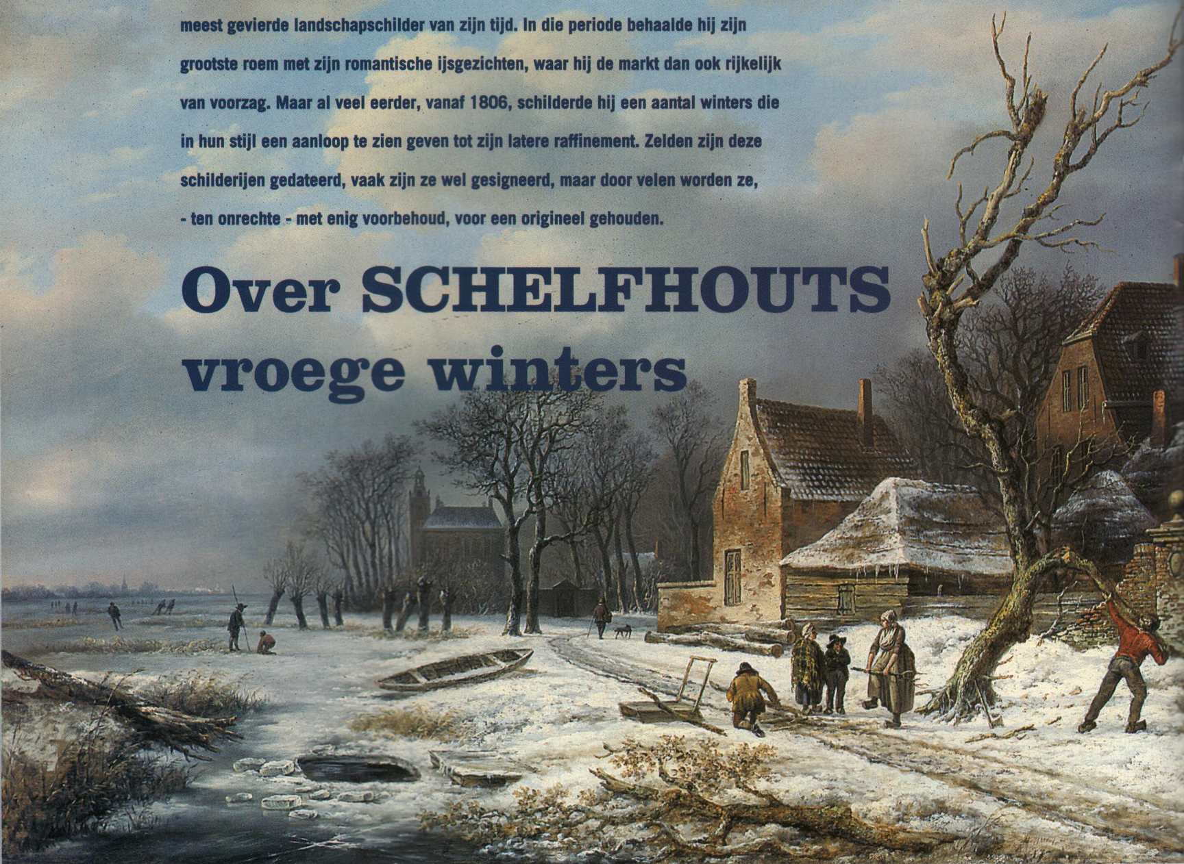
1. Winterlandschap met houtspokkelaars, rechter pendant, ca. 1815, 53 x 72.6cm. (Simonis&Buunk, Ede).