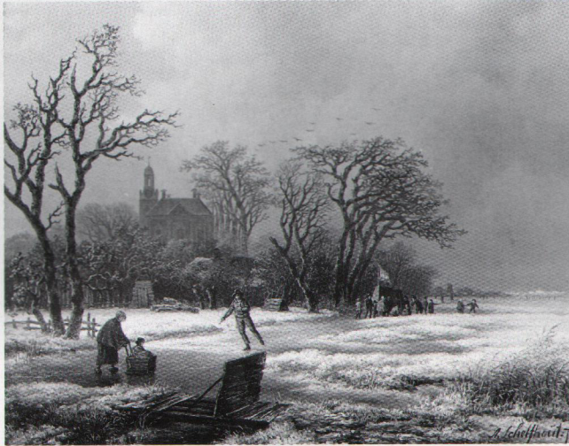
6. IJstafereel, 1806, 25 x 32.5 cm, (Museum Boijmans Van Beuningen, Rotterdam).