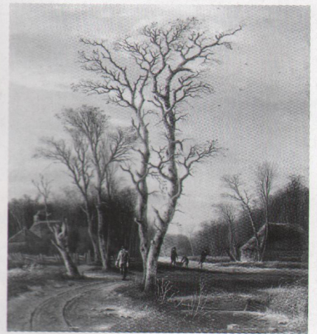
4. Winterlandschap met schaatsers, ca. 1812, ca. 50 x 40cm. (Phillips, Londen).

neerd te zijn. Die mogelijkheid viel toch volstrekt niet uit te sluiten. Ik greep direct de telefoon en belde de cliënt. Als Archimedes die net uit zijn bad was gestapt vertelde ik hem het hele verhaal. 'Mijnheer F., er zijn twee mogelijkheden: of u koopt mijn winter of ik koop uw zomer, géén tussenweg'. De cliënt, geïntrigeerd, kwam met zijn echtgenote en zijn zomerlandchap van Schelfhout de volgende dag al kijken. Het 'nieuwe paar' werd volop gefotografeerd, binnen en buiten, op alle plaatsen waar het licht weer net even beter viel. Alsof het een bruidspaar was. Een paar dagen later belde de cliënt. Hij kon de winter er vanwege ruimtegebrek niet bijkopen, maar bood me, heel fideel, zijn